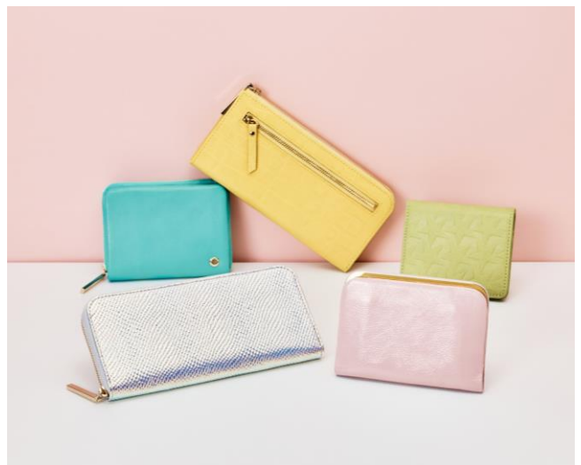
ウォレット 各種 ¥12,100～¥16,500(税込)

いろんな嬉しい運が舞い込む引きが強いカラーであり、ツキが膨らみお金の流れがポジティブに華やぎます。チャンスにとっても強くサイドビジネス運もアップ。臨時収入の期待もできるでしょう。