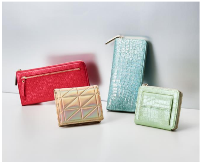
ウォレット 各種 ¥14,300～¥17,600(税込)

明るく澄んだライトトーンのブルーとグリーンは、知識や情報が収入に結びつくカラー。金運の流れを好転させ着実に金運を上昇させます。守りのエネルギーが高まるので、堅実タイプの人におすすめ。